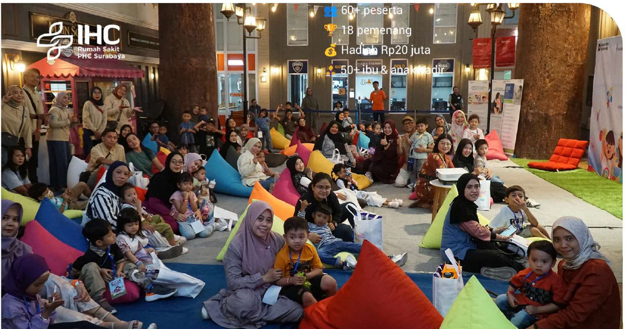
Kebersamaan Mom & Kids di KidZania Surabaya, Momen edukatif sekaligus menyenangkan bagi ibu dan anak.